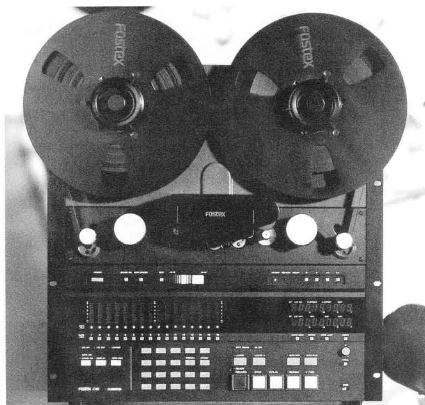
Fostex G 16: Solide gebaut, aber Endzeitstimmung für analoge Schmalspurformate.