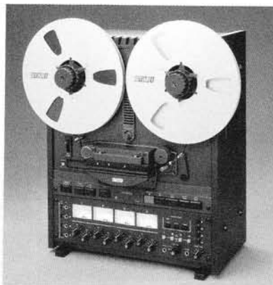
Otari MX 5050 B-II von 1980 als Master- oder Mehrspurrecorder im Einsatz.

Aufbauend auf der 50-er Viertelzoll-Serie (Seite 65), bot Otari zwischen 1980 und 1982 die Maschinen auch in Mehrspurverson an. Es waren die MX 5050 B-II als Vierspurmaschine, sowie ab 1982 die MX 5050 MK-III in Vierspur- und Achtspurausführung auf Halb Zollband. Die Technischen Daten entsprachen etwa denen der Zweispur-Versionen.